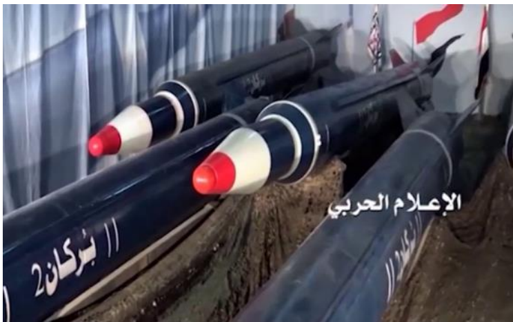
Missiles Burkan-2 présentant des têtes triconiques et des ailerons arrière

Le Burkan-2, comme le Burkan-2H, possède les mêmes dimensions que le Qiam-1, long de 11,5 m 64 . Les Burkan-2, lancés à partir de TEL ressemblant à ceux utilisés en Iran, possèdent eux aussi des têtes triconiques, qui diffèrent du cône effilé caractéristique des Scud B et C et du Burkan-1. Ce type de coiffe se retrouve sur les Shahab-3 et les No Dong, mais aussi sur les Qiam-1, seul système Scud à utiliser ce type de coiffe. Cette forme de tête indique que le Burkan-2 est doté d'une charge moins volumineuse que le Burkan-1, mais qu'elle est probablement séparable, permettant son usage sur des missiles conçus pour des portées supérieures à 800 km et plus stable pendant la rentrée dans l'atmosphère 65 .