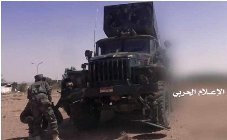
Lanceur Badr à tubes jumeaux (Almasirah)

Par ailleurs, les médias locaux inscrivent au nombre des attaques balistiques de nombreuses frappes en réalité réalisées au moyen de vecteurs reconvertis, dérivés de missiles anti-aériens (SAM). Les Houthis ont notamment obtenu le missile Qaher-1 à partir du SAM soviétique S-75 Dvina (SA-2), dont les forces armées yéménites détiennent entre 800 et 1 000 exemplaires, à la suite de transferts opérés par l'URSS à