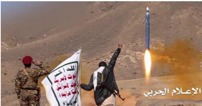
Lancement d'un Burkan-2H par les Houthis, le 19 décembre 2017. On note l'absence d'ailerons arrière

De surcroît, le fait que les moteurs des vecteurs demeurent les mêmes que ceux des Scud iraniens de type Hwasong-5 et 6 s'accorde avec cette analyse. Les estimations divergent en effet sur la capacité de l'Iran à produire localement des moteurs-fusées de type Scud. Des sources du renseignement israélien rapportent qu'il existe une capacité indigène de production de tels moteurs mais selon d'autres sources, l'Iran « n'a pas démontré à ce jour sa capacité de fabriquer les moteurs » des Shahab-1, 2 et des Qiam 80 .